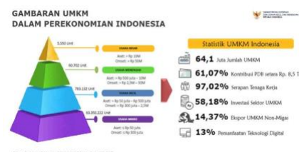
Gambar 1. Peranan UMKM dalam Perekonomian Indonesia

Usaha mikro, kecil, dan menengah (UMKM) merupakan sektor penting yang terus berkembang dan berkontribusi pada perekonomian serta penciptaan lapangan kerja di Indonesia (Tikaromah et al., 2025) seperti terlihat pada gambar 1, berikut ini: