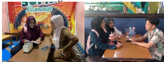
Gambar 3. Kegiatan wawancara kepada mitra

Sebelum tim melaksanakan kegiatan pengabdian kepada masyarakat terkait penggunaan aplikasi keuangan Moni, tim melakukan observasi dan wawancara kepada mitra. Pada saat wawancara mitra menyampaikan bahwa mereka mengalami kesulitan dalam pengelolaan keuangan, terutama keuangan usaha.