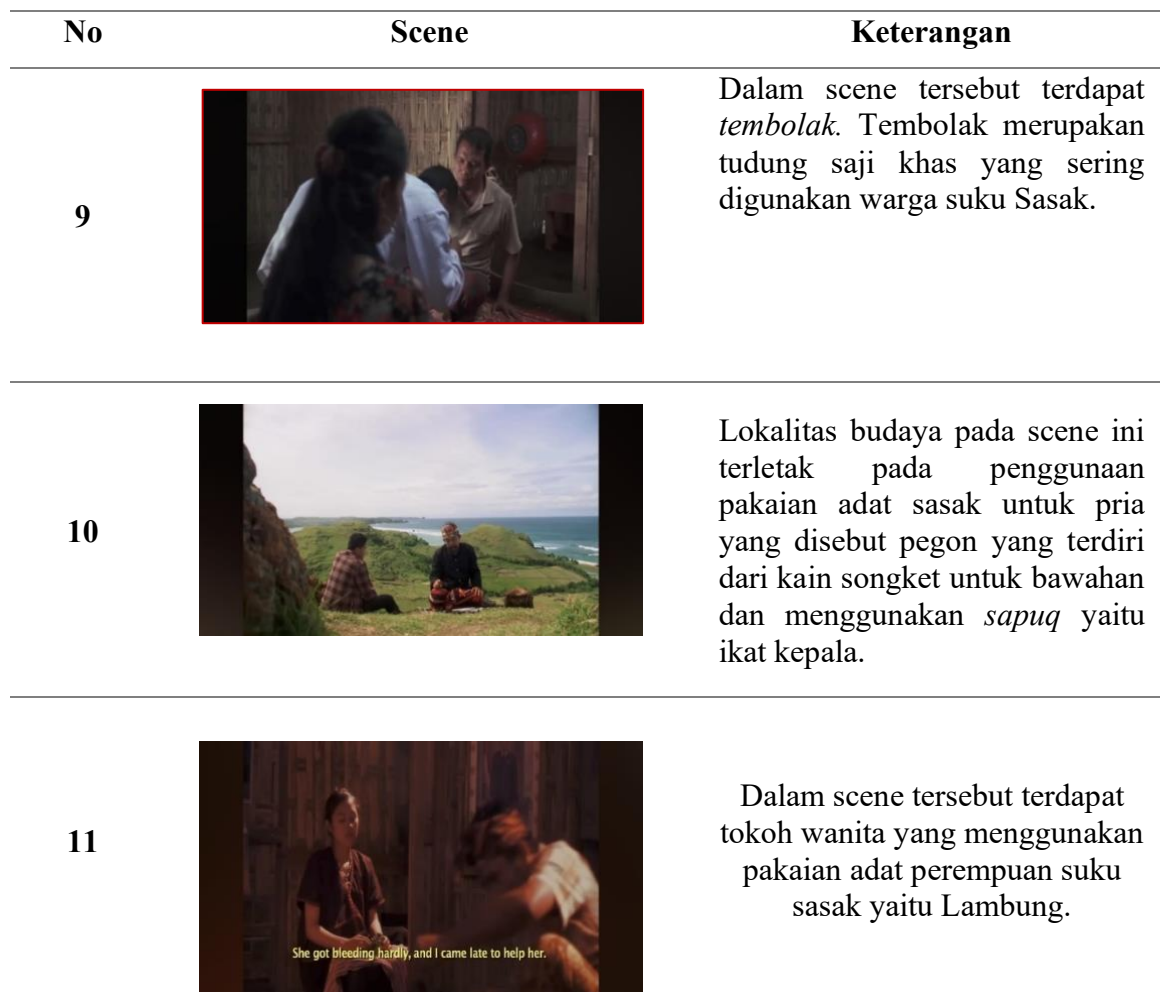
Tabel 4. Sistem Tekhnologi

Lokalitas budaya dalam scene tersebut terletak pada dinyanyikannya lagu daerah suku sasak yaitu lagu Tegening-Teganang.